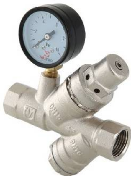
КЛАПАН ПОДПИТОЧНЫЙ С ФИЛЬТРОМ И МАНОМЕТРОМ

Произведено по технологии: VALTEC s.r.l., Via Pietro Cossa, 2, 25135-Brescia, ITALY Изготовитель: «ZHEJIANG VALTEC PLUMBING EQUIPMENT CO.,LTD», No.121 Hongxing Road, Economic & Technology Development Zone, Qiaonan District, Xiaoshan District, Hangzhou, China,;